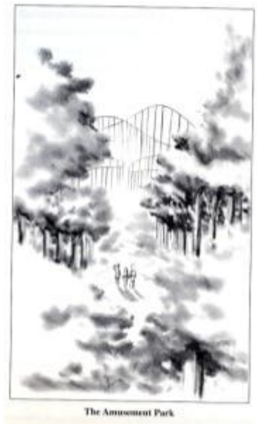
The Amusement Park